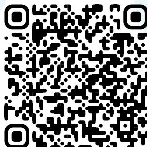
Сообщество VK проекта «Знание. Игра»